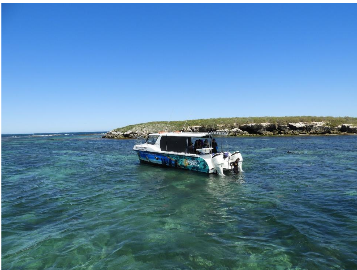
фото-трофеи. После легкого перекуса и чашечки кофе, мы двинулись обратно в порт, счастливые и довольные. Да, эта замечательная австралийская семья на самом деле создала прекрасную компанию, несущую хорошее настроение всем любителям моря, и просто туристам. Стоит ли говорить, что если когда-нибудь наша дорога вновь пройдет мимо этого порта, то мы обязательно заглянем к ним еще.